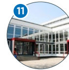
11 Chemie Martin-Luther-King-Platz 6 (MLKP 6)