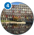
4 Erziehungswissenschaft Von-Melle-Park 8 (VMP 8)