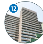
12 Geomatikum Bundesstraße 55 (BU 55)