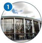
1 Audimax Von-Melle-Park 4 (VMP 4)