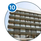
10 Zoologie Martin-Luther-King-Platz 3 (MLKP 3)