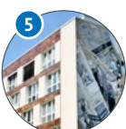
5 Sozialökonomie Von-Melle-Park 9 (VMP 9)