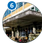
6 Rechtshaus Schlüterstraße 28 (S 28)