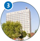
3 Phil-Turm Von-Melle-Park 6 (VMP 6)