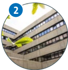
2 WiWi Von-Melle-Park 5 (VMP 5)