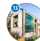
13 Tiny House Von-Melle-Park